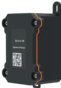
Рисунок 1 – Внешний вид датчика

Внешний вид датчика представлена на рисунке 1.