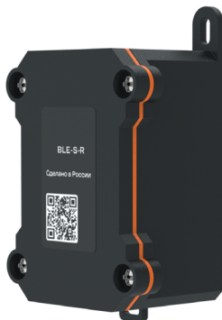
Рисунок 1 – Внешний вид датчика

Внешний вид датчика представлена на рисунке 1.