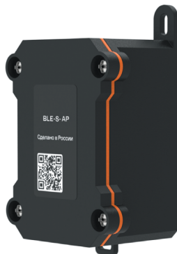
Рисунок 1 – Внешний вид датчика

Внешний вид датчика представлена на рисунке 1.