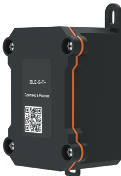
Рисунок 1 – Внешний вид датчика

Внешний вид датчика представлена на рисунке 1.